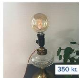
Anden bordlampe, Meget ...