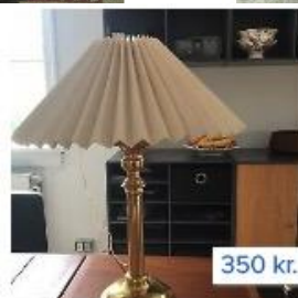
Anden bordlampe, Fin me...