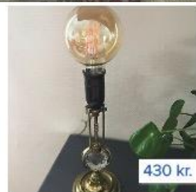
Anden bordlampe, Meget ...